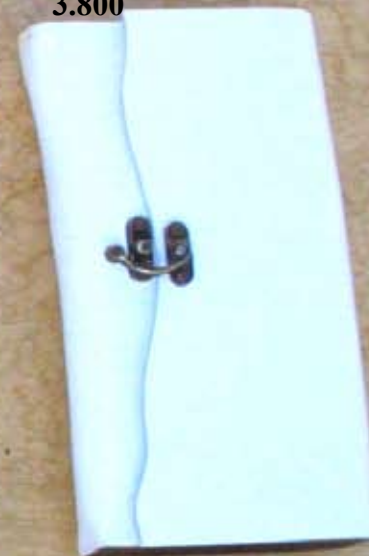
Sac de femme pour soirée 3.800