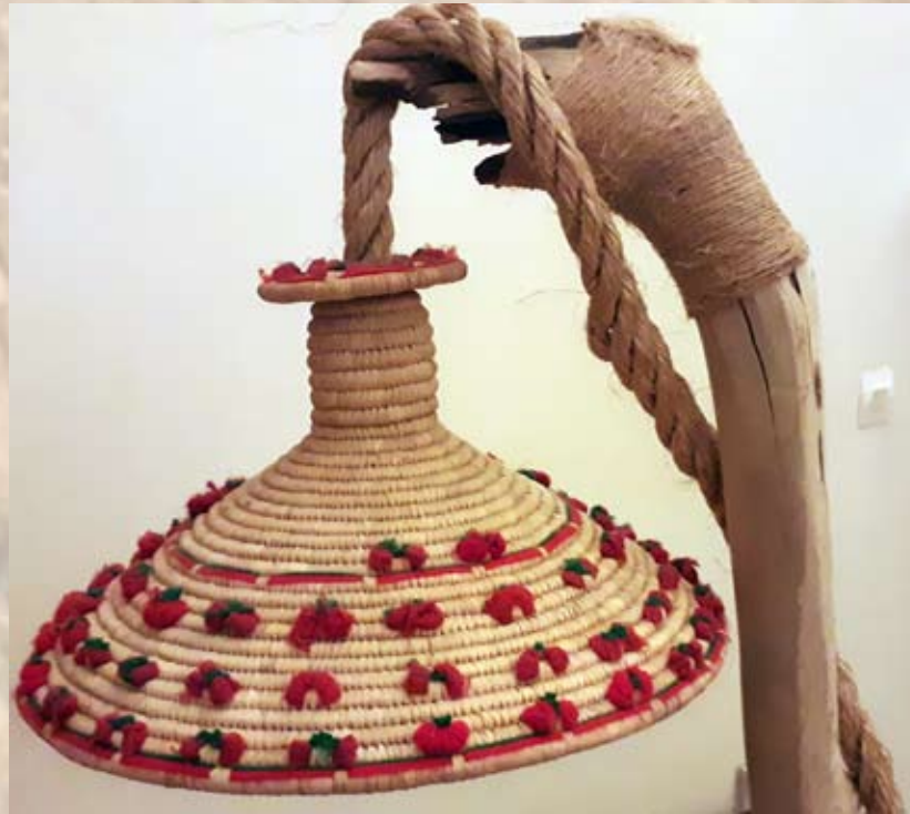
Lampadaire sur tronc d'arbuste récupéré dans le désert et poli à la main, serti sur socle en toile épaisse. 15 000