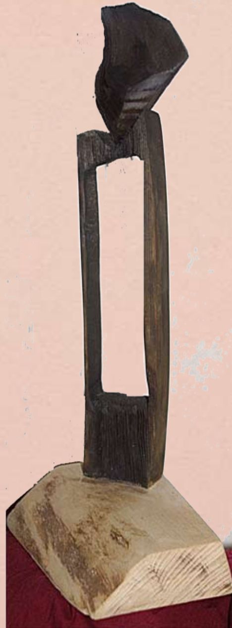
Homme debout 15,5 cm x e 3cm x H 24 cm 3 500