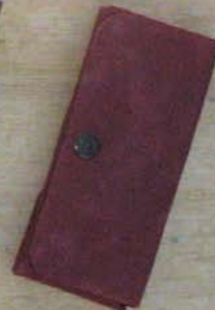
Etui à lunettes 1.200