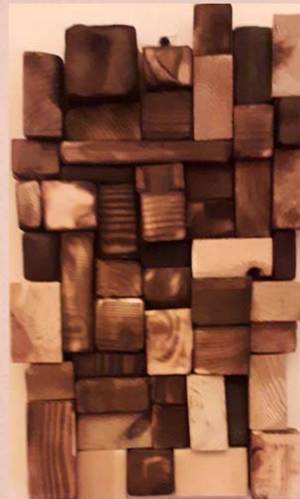
Le YANG Eclats de bois teinté au feu 25cm x 43 cm 2 500