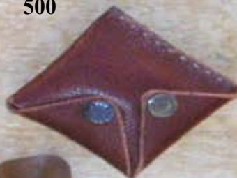
Petit porte monnaie 500