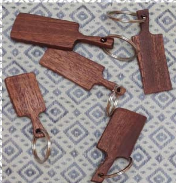
Portes clefs en chêne 400 l'unité