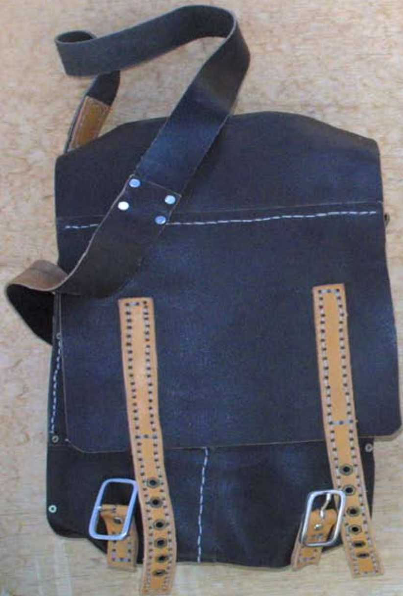
Sac en Bandoulière en bois de chêne et cuir 4.000