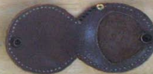
Porte monnaie 800