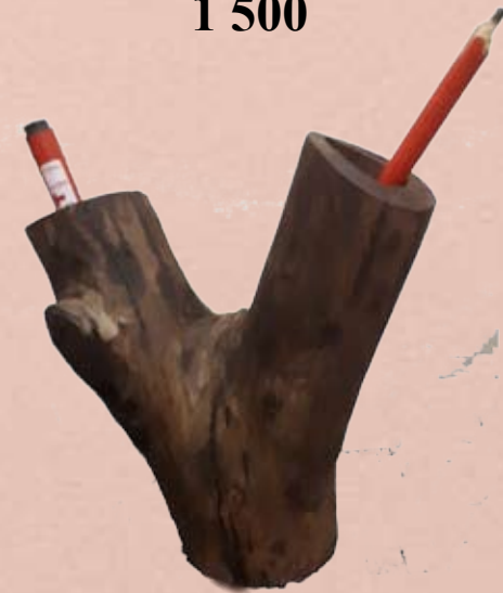
Porte stylos creusé dans un bois recupéré 1 500