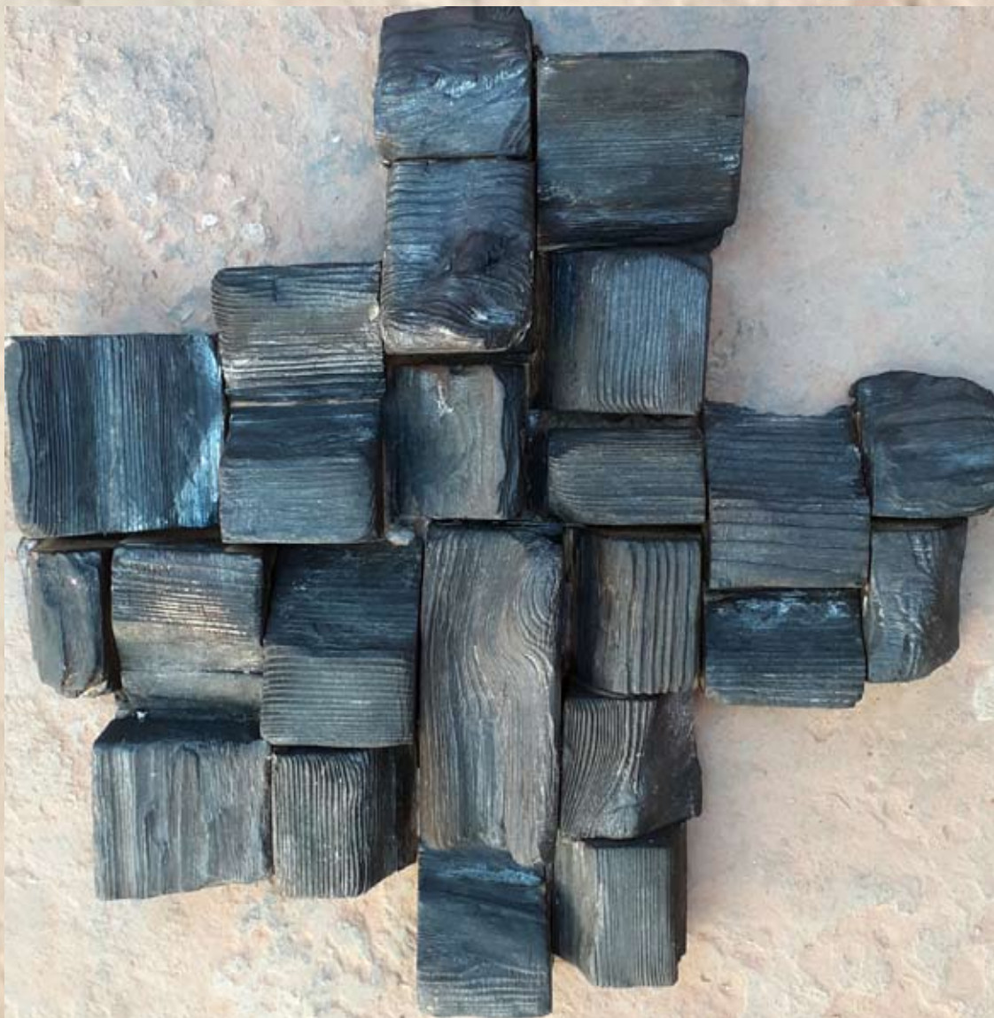
Eclats de bois peints 34 cm x 34 cm 1 500