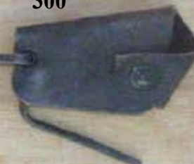
Porte clés 300