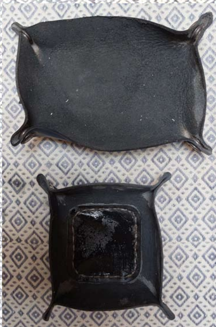
Vides poches en cuir noir 1000 l'unité ou 1800 les 2