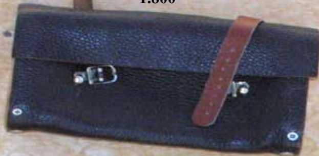
Sacoche ceinture pour telephone 1.800