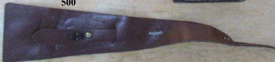
Bracelet de force mixte 500