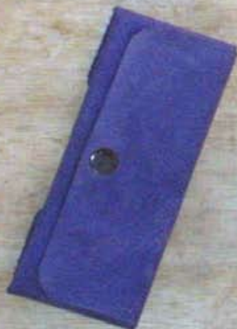
Etui à lunettes 2.500