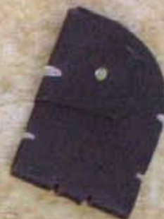
Porte clés 500