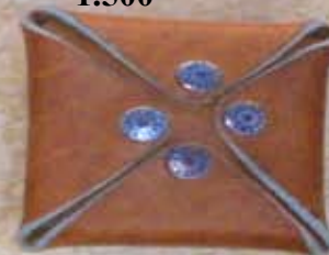
Porte monnaie 1.500