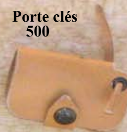
Porte clés 500