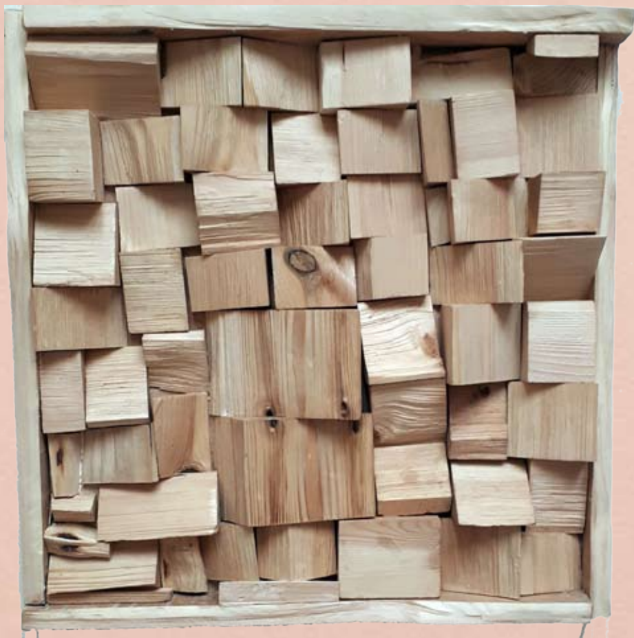
Le YIN Eclats de bois naturel 50cm x 50 cm 3 500