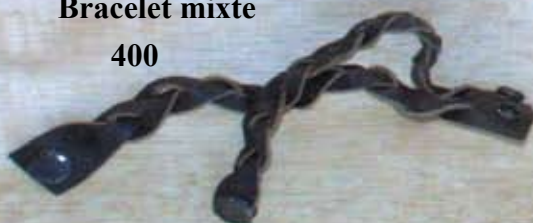
Bracelet mixte 400