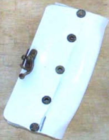
Etui à lunettes en bois et cuir 3.000