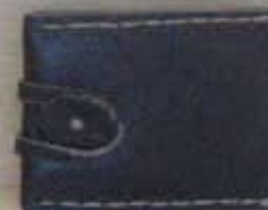
Porte monnaie 900