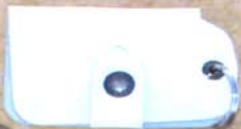
Porte clés 700