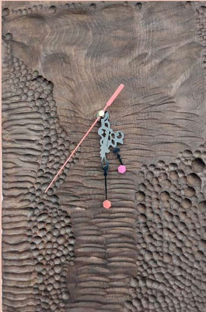
Horloge sur panneau bois 21 cm x 32 cm 5 000 DA