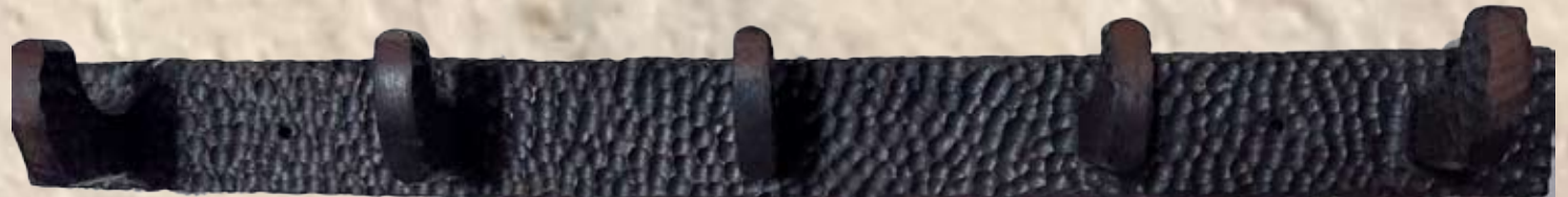
Porte manteaux en bois sculpté 48 cm x 4 cm 2500 Da