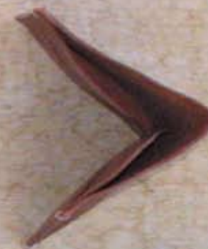
Porte cartes et billets 2.200