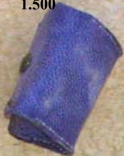
Porte monnaie 1.500