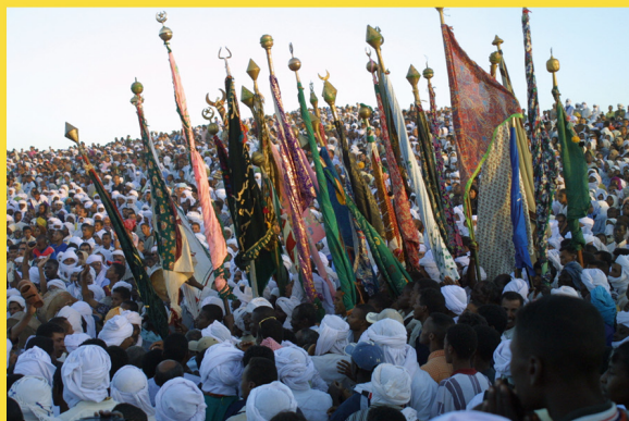
Arrivée des drapeaux à la Zaouia Sidi Hadj Belkacem