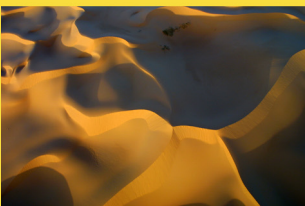
Dunes de Tala vues du ciel