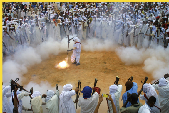
Cercle de barud au djebel Sbou'