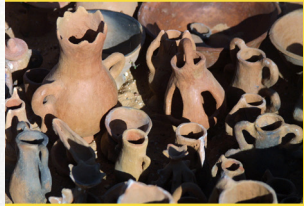
Poteries de Kali