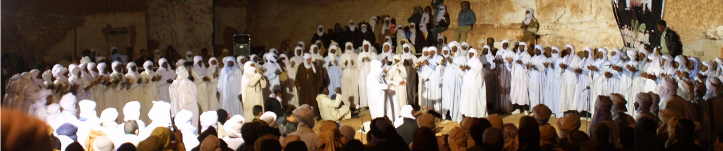
Clôture du 1er festival national de Ahellil