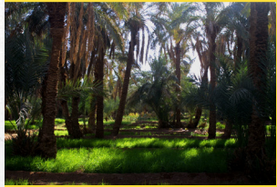
Cultures de blé