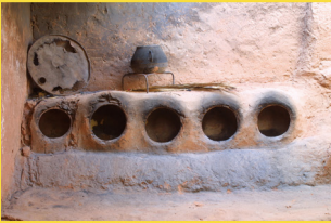
Four à pain traditionnel