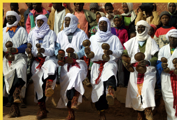
Danse des karkabous à la Sidna Boulal