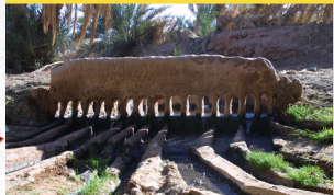
Kesria de la foggara Amghir