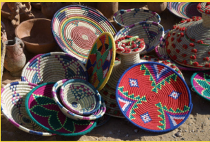
Vanneries de Kali