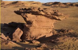
Sculptures du vent à Tmana