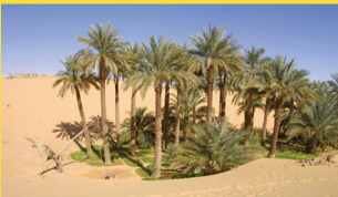
Beirda à Taghouzi