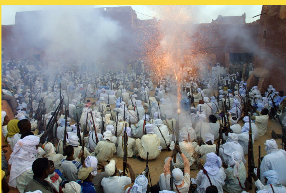
Barud au Meshwar