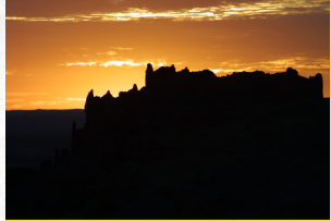
Soleil couchant sur Ighzer