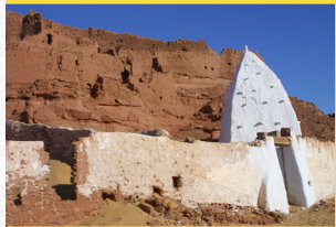
Sidi Abderrahmane à Ighzer